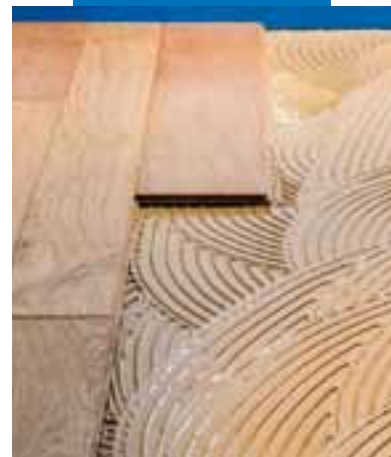
Verlegung von Parkett

12 Monate im ungeöffneten Originalgebinde bei kühler und normaler Lagerung. Bei Transport über längere Strecken sind klimatisierte Container zu verwenden.