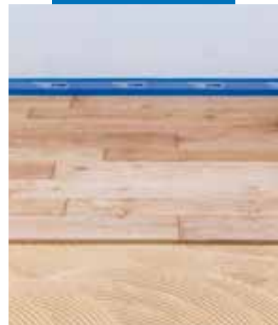
Verlegung von Parkett