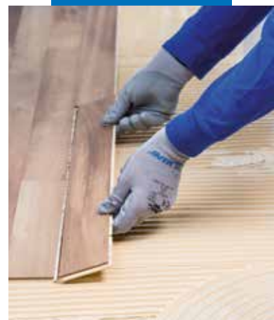
Verlegung des Parketts